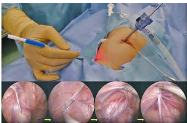
腹腔鏡下鼠径ヘルニア手術(LPEC法)：ヘルニアの出口のところを縛って塞ぎます。(1)

手術は、袋状になっている腹膜鞘状突起をお腹からの出口になるところで縛って塞ぎ、腹腔内の臓器が脱出しないようにします。鼠径部を切開して行う方法と、腹腔鏡を使って行う方法があります。（左図参照）当院小児外科では、2012年から